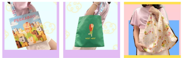
กระเป๋าผ้า ด้านหน้า