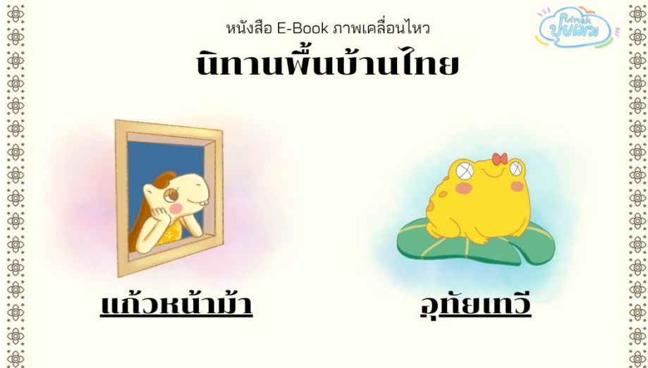
E-book นิทานพื้นบ้านไทย