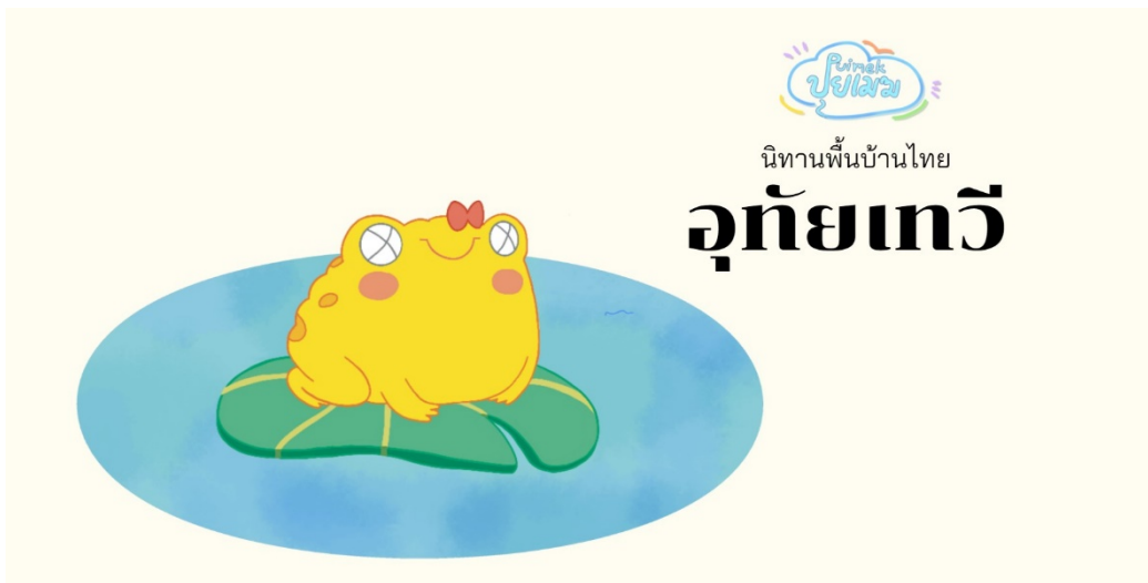
E-book นิทานพื้นบ้านไทย “อุทัยเทวี”