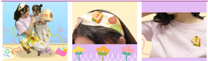
ชุดคู่ แม่-ลูก