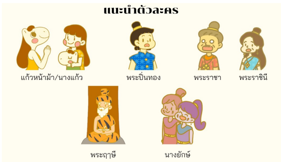
แนะนำตัวละคร “แก้วหน้าม้า”