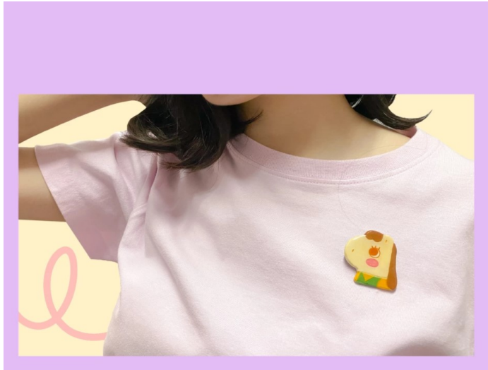
เข็มกลัดแก้วหน้าผ้า