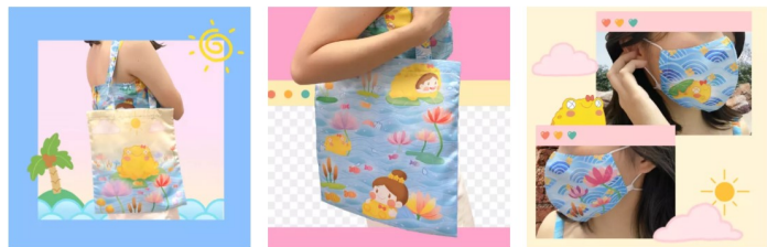
กระเป๋าผ้า ด้านหน้า