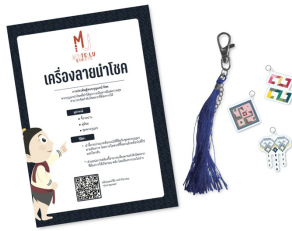
รูปภาพที่ 3 กิจกรรมที่ 2 เครื่องลายนำโชค

กิจกรรมที่ 3 แต้มีสี่เสริมดวง การระบายสีป้ายห้อยกระเป่าเดินทาง โดยป้ายห้อยกระเป่าเดินทางเป็นสิ่งที่จำเป็นในการเดินทางเพื่อป้องกันภัยอันตรายและเป็นเจ้าของ จะดียิ่งขึ้นหากป้ายห้อยนั้นมีความหมายเสริมดวงต่อผู้ใช้ อุปกรณ์ ได้แก่ ป้ายห้อยกระเป่าเดินทาง การ์ดสำหรับเขียนชื่อและระบายสี สติกเกอร์สำหรับตกแต่ง สีไม้ สื่อการเรียนรู้ คือ คู่มือทำกิจกรรม วิธีทำกิจกรรมเริ่มจากเลือกการ์ดตามความหมายที่ต้องการ เขียนชื่อตนเองและข้อมูลการติดต่อที่สำคัญลงบนที่การ์ด จากนั้นระบายสีตกแต่ง และแปะสติกเกอร์ตกแต่งทั้งด้านหน้าและด้านหลังการ์ด และนำการ์ดใส่ลงในป้ายห้อยกระเป่าเดินทาง และนำไปแขวนตามต้องการ