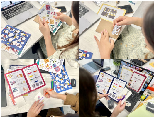
รูปภาพที่ 5 การทดสอบชุดกิจกรรมศิลปะแบบผสมผสานกับกลุ่มเป้าหมาย

หลังทำกิจกรรมกลุ่มเป้าหมายทุกกลุ่มวัย มีระดับความสนใจที่จะเดินทางมาท่องเที่ยวจังหวัดน่าน ค่าเฉลี่ย 7.00 ส่วนเบี่ยงเบนมาตรฐาน 1.53 โดยส่วนใหญ่มีระดับความสนใจอยู่ที่ 8 คะแนน และ 5 คะแนน จำนวนอย่างละ 7 คน (ร้อยละ 23.33) ส่วนจากการประเมินผลความรู้ด้วยตนเองของกลุ่มเป้าหมายมีระดับความรู้เกี่ยวกับศิลปะผ้าทอจังหวัดน่านหลังทำกิจกรรม ค่าเฉลี่ย 7.13 ส่วนเบี่ยงเบนมาตรฐานเท่ากับ 1.65 โดยส่วนใหญ่มีระดับความรู้อยู่ที่ 8 คะแนน จำนวน 10 คน (ร้อยละ 33.33) และมีระดับความสนใจในศิลปะผ้าทอจังหวัดน่านหลังทำกิจกรรม (ค่าเฉลี่ย 0.77, S.D. 0.42) มากกว่าก่อนทำกิจกรรม (ค่าเฉลี่ย 0.17, S.D. 0.45)