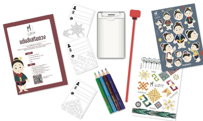
รูปภาพที่ 4 กิจกรรมที่ 3 แต้มีสี่เสริมดวง

กิจกรรมที่ 3 แต้มีสี่เสริมดวง การระบายสีป้ายห้อยกระเป่าเดินทาง โดยป้ายห้อยกระเป่าเดินทางเป็นสิ่งที่จำเป็นในการเดินทางเพื่อป้องกันภัยอันตรายและเป็นเจ้าของ จะดียิ่งขึ้นหากป้ายห้อยนั้นมีความหมายเสริมดวงต่อผู้ใช้ อุปกรณ์ ได้แก่ ป้ายห้อยกระเป่าเดินทาง การ์ดสำหรับเขียนชื่อและระบายสี สติกเกอร์สำหรับตกแต่ง สีไม้ สื่อการเรียนรู้ คือ คู่มือทำกิจกรรม วิธีทำกิจกรรมเริ่มจากเลือกการ์ดตามความหมายที่ต้องการ เขียนชื่อตนเองและข้อมูลการติดต่อที่สำคัญลงบนที่การ์ด จากนั้นระบายสีตกแต่ง และแปะสติกเกอร์ตกแต่งทั้งด้านหน้าและด้านหลังการ์ด และนำการ์ดใส่ลงในป้ายห้อยกระเป่าเดินทาง และนำไปแขวนตามต้องการ