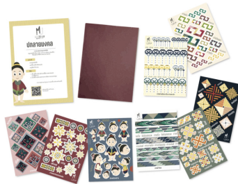
รูปภาพที่ 2 กิจกรรมที่ 1 ปกลายมงคล

มีอุปกรณ์ ได้แก่ สติกเกอร์สำหรับตกแต่งและสมุดจดบันทึก สื่อการเรียนรู้ ได้แก่ คู่มือทำกิจกรรมที่บอกถึงชื่อกิจกรรม แนวคิด อุปกรณ์ วิธีทำกิจกรรม วัตถุประสงค์การทำกิจกรรม ส่วนเนื้อหาบอกถึงความหมายของลวดลายศิลปะผ้าทอจังหวัดน่าน ความหมายของสีในลวดลาย บูรณาการกับสื่อแพลตฟอร์มดิจิทัล ได้แก่ วัตถุประสงค์กรรมวิธีการทำผ้าทอ ภาพอินโฟกราฟิก (Infographic) บอกชนิดของศิลปะผ้าทอจังหวัดน่าน แนะนำรูปแบบการตกแต่งจัดวางสติกเกอร์บนหน้าปกสมุด และแบบประเมินกิจกรรม วิธีการทำกิจกรรมเริ่มจากการเลือกสติกเกอร์ลายผ้าทอที่มีความหมายมงคลตามที่ต้องการแล้วแปะสติกเกอร์ตกแต่งตามความต้องการลงบนปกสมุด